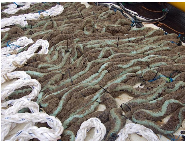
Gesokte mosselen

werden. Daardoor werden de krachten die het systeem 'voelt', aan bijvoorbeeld de ankerketting of de mosseltouwen, geregistreerd en draadloos doorgestuurd. De metingen toonden aan dat de krachten hoofdzakelijk veroorzaakt worden door de stroming en de golven. Korte pieken in de krachten zijn te wijten aan de golven, terwijl krachten met een lage frequentie (13 uren van piek tot piek) het gevolg zijn van de stroming. Deze bevindingen worden gestaafd door de golven die een nabijgelegen golfboei heeft gemeten en door de berekeningen van de stroming. De gemeten krachten werden vergeleken met de resultaten van de ontwikkelde numerieke modelsimulaties. Het resultaat toonde aan dat de posities en de krachten van het computermodel goed overeenkomen met de metingen op de krachtlijn. Deze resultaten gaven het vertrouwen om de meest geschikte relatieve positie van het systeem ten opzichte van de stroming te vinden. De resultaten hiervan laten bovendien de invloed zien van de positie op de oppervlakte die het systeem precies inneemt in het water. Een bijkomende studie naar de invloed van de golven toonde aan dat er een optimale diepte bestaat om het systeem onder het wateroppervlak te plaatsen. Op basis van voorgaande bevindingen kunnen er bepaalde kweekopstellingen voorgesteld worden om een maximale mosselproductie te bekomen, terwijl de beschikbare ruimte in het windturbinepark maximaal wordt benut en er toch een betrouwbaar systeem wordt uitgebaat.