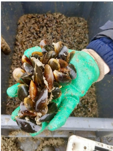
De eerste mosseloogst

Het project had als doelstelling te onderzoeken of: (i) offshore mosselkweek in de Belgische Noordzee biologisch en (ii) technisch mogelijk was en of dit (iii) een rendabele activiteit zou kunnen worden, rekening houdend met de mogelijke synergiën tussen energieproductie en aquacultuur. Samenvattend kunnen we