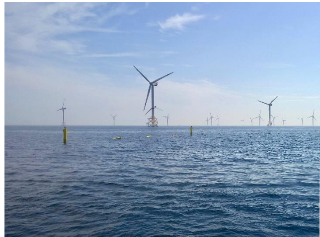
De biolijn in het windpark van C-Power

Het eerste mosselkweekstelsel, de zogenaamde biolijn, was een biologisch testplatform, bedoeld om mosselzaad in te vangen en de groei van de mosselen te bestuderen. Dat de biolijn in mei werd te water gelaten, is geen toeval. De natuurlijke voortplantingsperiode van de mosselen bereikt namelijk een piek in de maanden april en mei. Miljoenen mossellarven zweven dan in de waterkolom en zoeken na enkele weken een geschikt substraat om zich op vast te hechten en verder uit te groeien tot volwassen mosselen. Door verschillende soorten mosseltouw aan de backbone te hangen, werd hier getest welk type touw de meeste larven aantrok en deze ook kon laten doorgroeien tot consumptiemosselen. Dit proces werd bovendien verschillende jaren na elkaar herhaald, om toeval in de waarnemingen uit te sluiten.