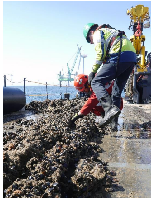
Het afoogsten van de mosselen

Edulis is een wereldwijde primeur, waarbij mosselen niet alleen offshore werden gekweekt, maar ook binnen een windpark. Het meervoudig gebruik van ruimte ('multi-use of ocean') wordt door de Europese Unie beschouwd als een prioriteit voor de realisatie van blauwe groei. Het is echter niet evident om een dergelijke samenwerking met bestaande windparken concreet te realiseren. Meer specifiek er moet rekening gehouden worden met o.a. de volgende fundamentele barrières: (i) windparken zijn momenteel niet gedimensioneerd om voeding te produceren, (ii) windparken zijn ook niet georganiseerd om voeding te produceren en tot slot (iii) impliceert de aanzienlijke afstand van de windparken tot de kust een negatief effect op de exploitatiekosten. Bij het ontwerpen van toekomstige windparken, dienen bovenstaande vereisten dus in rekening gebracht te worden om beide activiteiten te kunnen combineren.