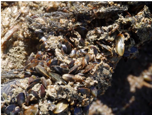
Jong mosselzaad op de kweektouwen

op die plaats het water in de volledige waterkolom, die daar 25 m diep is, meestal over de ganse diepte volledig gemengd is, en er dus overal evenveel voeding aanwezig is.