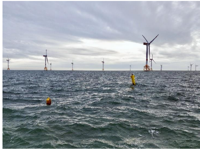
De krachtlijn in het windpark van Belwind

De tweede testinstallatie, de krachtlijn genoemd, moest de impact van stroming, golven en getij op de verankering, de backbone en de mosseltouwen meten. Een kweekstelsel, en zeker een commercieel, moet immers geschikt zijn om de ruwe omstandigheden op volle zee te kunnen doorstaan. De plaatsing van de krachtlijn vlak voor de winter was dan ook een logische keuze, aangezien het risico op stormen en zware zee dan toeneemt en er grotere krachten kunnen verwacht worden. We wilden het systeem namelijk maximaal testen. Het meten van de krachten gebeurde door middel van verschillende krachtmeters die in het systeem ingewerkt